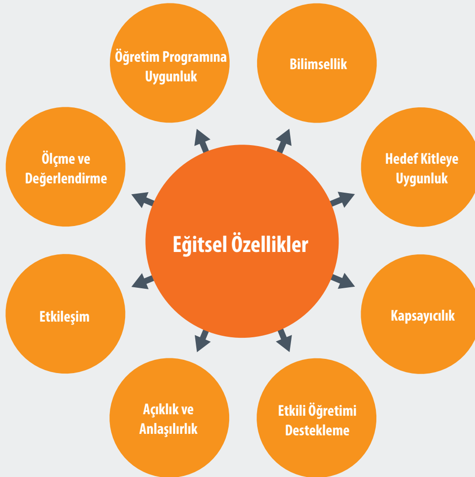
Şekil 2. E-içeriklerde bulunması gereken eğitsel özellikler

Eğitsel özellikler, e-içeriklerin geliştirilmesinde hem hedef kitlenin ilgi ve ihtiyaçlarına cevap vermek hem de öğrenme amaçlarına en etkili şekilde ulaşmak için dikkate alınması gereken özelliklerdir. Bu bölümde öğrenme kuramları ve iyi uygulamalardan yola çıkılarak, e-içeriklerin öğretim programına uygun olması, bilimsel standartlara dayandırılması, hedef kitleye uygun ve kapsayıcı olması, etkili öğretimi desteklemesi, açık ve anlaşılır olması, etkileşimli olması ve e-içeriklerde ölçme-değerlendirme uygulamaları gibi eğitsel özellikler ele alınmıştır (Şekil 2). Sıralanan eğitsel özellikler, kaliteli e-içerikler geliştirilmesine dolayısıyla etkili ve verimli bir öğrenme/öğretme deneyimi oluşmasına rehberlik edecektir.